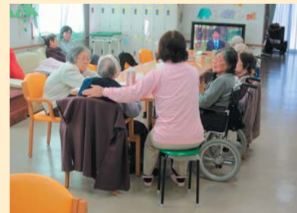
テイルームで過ごすひととき。