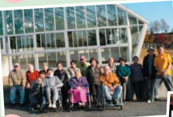
見土呂フルーツパーク