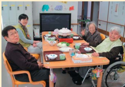
お鍋で身も心も温まって頂きました。

できる限り住み慣れた地域での生活が継続できるように平成18年に創られた地域密着型サービスの1つです。登録制で、通いを中心に訪問や短期間の宿泊などを組み合わせて、サービスを提供することで在宅生活を支援します。尾上の郷小規模多機能施設は登録定員25名、一日の通い定員15名、宿泊定員9名となっています。泊まりの居室は全て個室となっており、ゆったりと過ごして頂けます。利用者家族様からも普段通っている所に泊まれるので安心...という声もいただいています。