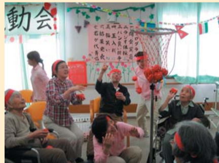
運動会...チーム対抗で頑張りました。

こじんまりと アットホームな雰囲気、 また今日も行きたいなあ...って 思われる事業所を 目指して頑張ります!!