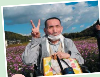
コスモス畑(志方町)